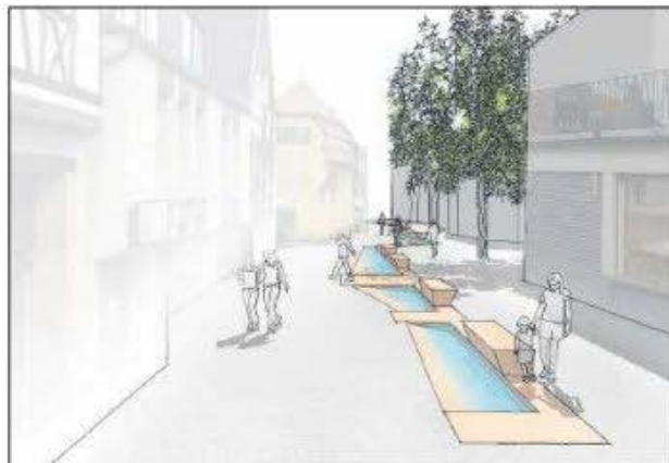
Blick in Richtung Laustergasse: Hier sind eine etwa eineinhalb Meter breite Rinne sowie Sitzgelegenheiten geplant. Auf der nördlichen Seite bleibt Platz für Rettungsfahrzeuge.

Die Graphik ist limitiert und direkt über den Künstler (Telefon: 06321/33838, E-Mail: hofmann-neustadt@t-online.de) zu beziehen, der Wein wird ab März in der Kleinen Herberge in der Mittelgasse verkauft. |jkr